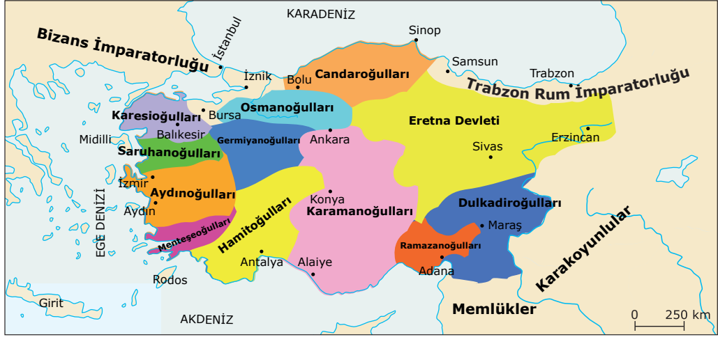
Anadolu Beylikleri XIV. yy Başları

Verilen harita incelendiğinde aşağıdaki bilgilerden hangisine ulaşamaz ?